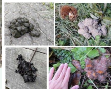
調べたもの：（上段左から）黒っぽい、クマ （下段左から）サクランボの実、カキ 「美の国あきたネット ツキノワグマ情報」より