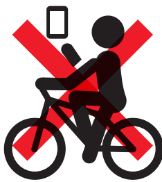
ながらスマホ【反則金 12,000 円】 （保持）