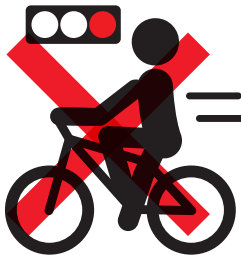
信号無視【反則金 6,000 円】