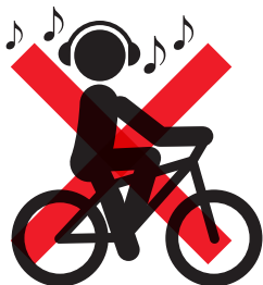
ヘッドホン（イヤホン）【反則金 5,000 円】 ※音量を上げ音楽を聴く等、安全な運転に必要な音声がかえらないような状態にすること。