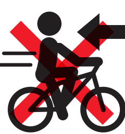
右側通行【反則金 6,000 円】