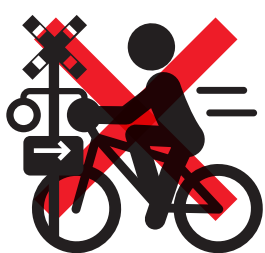
遮断踏切入り【反則金 7,000 円】