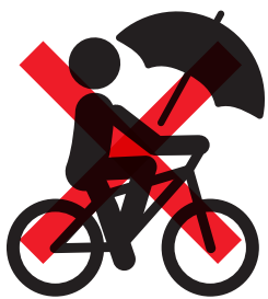
傘さし運転【反則金 5,000 円】