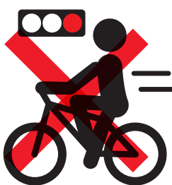
信号無視【反則金 6,000 円】