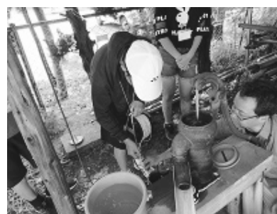
県環境研究センター 地質環境研究室