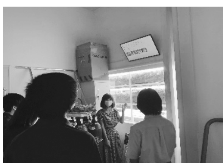
東葛テクノプラザ