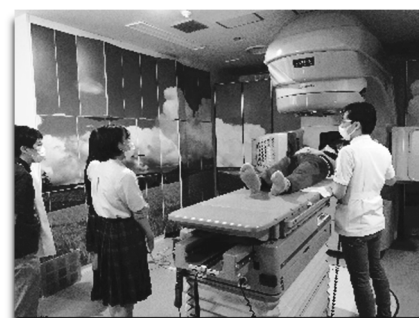
国立がん研究センター東病院