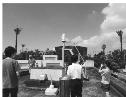
県環境研究センター 大気騒音振動研究室