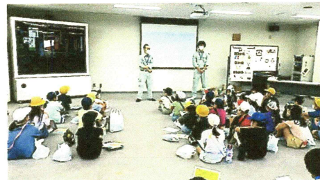
全体説明会の様子

先日の社会科見学では、ご協力ありがとうございました。職員の方のお話を熱心に聞き、実際にクリーンセンターを見ることでゴミや分別に対する意識を高めることができ、有意義な時間になりました。