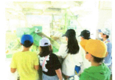
ビニールゴミの処理の様子の見学